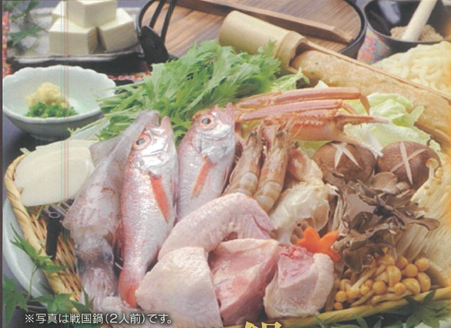
※写真は戦国鍋(2人前)です。